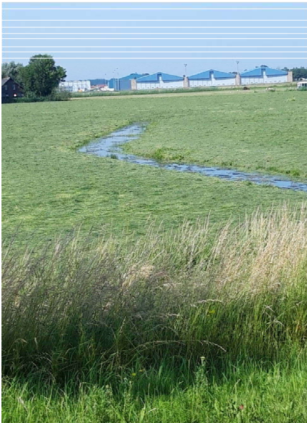
Figuur 3-4. Foto gemaakt aan de Kooltuinweg.