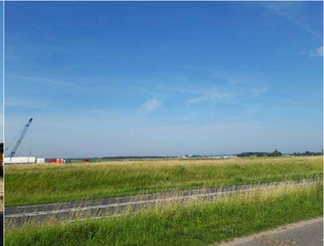
Figuur 3-3. Foto gemaakt aan de achterweg.