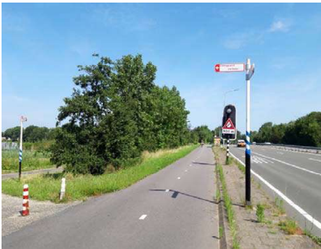
Figuur 3-8. Foto gemaakt ter hoogte van de Zanderij.