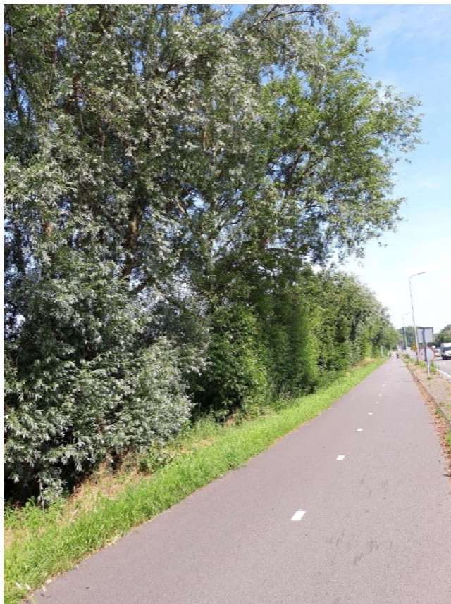
Figuur 4-1. Bomenrij langs de N206 ter hoogte van de Zanderij

de Zeeweg zijn holtes waargenomen die mogelijk geschikt zijn voor vleermuizen. Deze bomen zullen in het voornemen blijven staan.