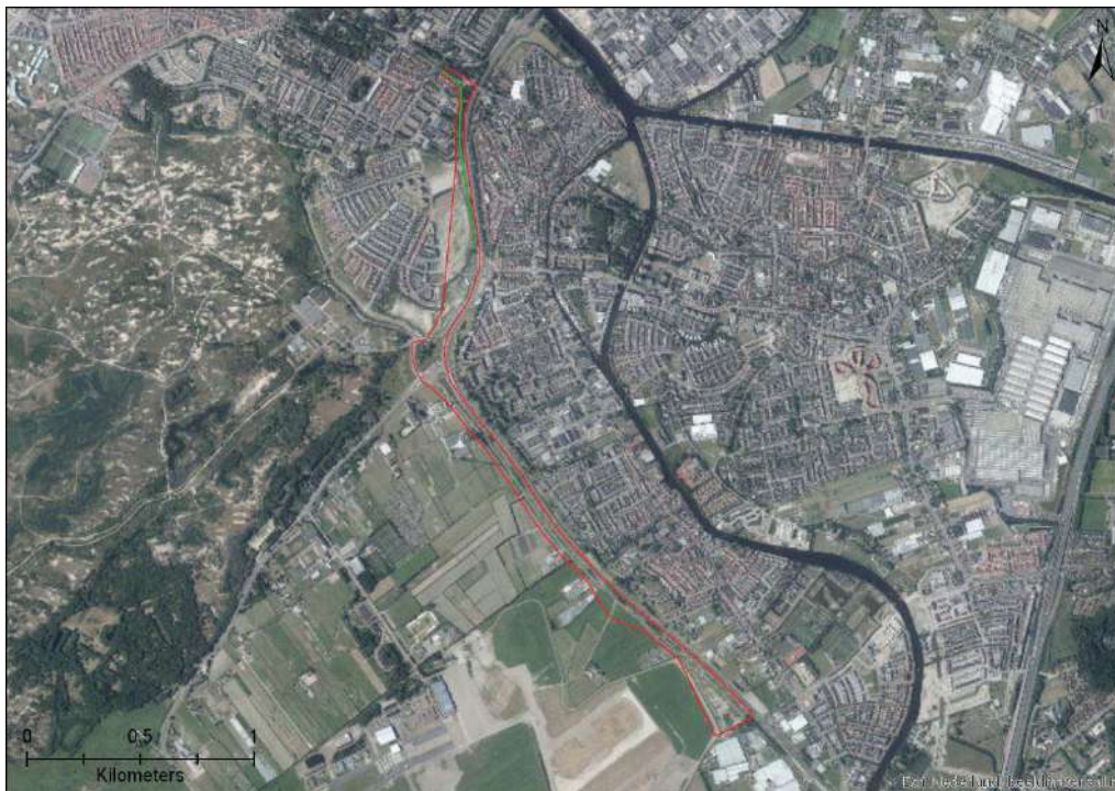
Figuur 4-3. Locatie van potentiële vliegroute (groene lijn) ten opzichte van het plangebied (rode lijn).

Conclusie: Binnen het onderzoeksgebied zijn waarnemingen bekend van meerdere soorten vleermuizen. Het overtreden van verbodsbepalingen uit de Wnb ten aanzien van vleermuizen kan daarom niet op voorhand worden uitgesloten.