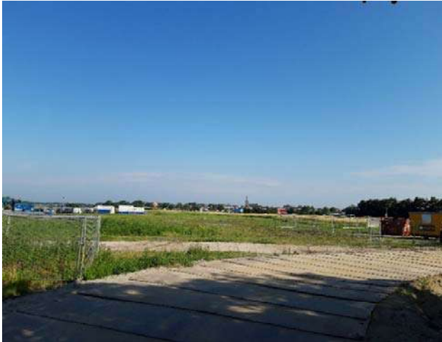
Figuur 3-2. Foto gemaakt aan de achterweg.