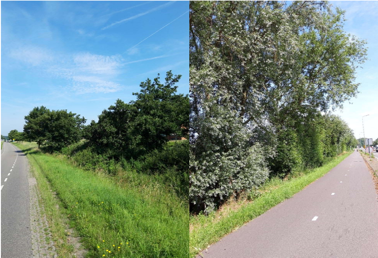
Figuur 3-6. Foto gemaakt aan de Koolduinweg.