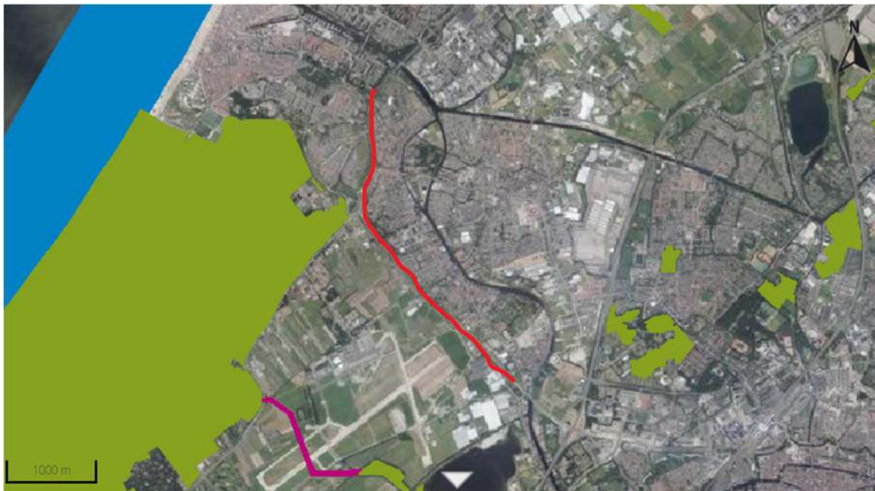
Figuur 5-2. Ligging van het plangebied ten opzichte van het NNN. Rode lijn: plangebied, overige kleuren: NNN.