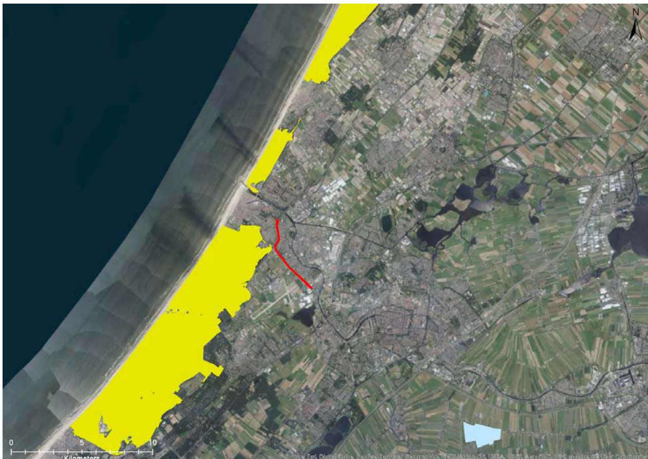
Figuur 5-1. Ligging van Natura 2000-gebieden ten opzichte van het plangebied. Bovenste gele gebied: Kennemerland-Zuid; middelste gele gebied: Coepelduynen; onderste gele gebied: Meijndel & Berkheide; blauwe gebied: De Wilck; rode lijn: plangebied.

Het plangebied maakt geen deel uit van een Natura 2000-gebied (Figuur 5-1). In de directe omgeving komen echter wel Natura 2000-gebieden. Natura 2000-gebieden die voorkomen in de omgeving van het plangebied en gevoelig zijn voor stikstofdepositie zijn Meijndel & Berkheide (100 m van plangebied), Coepelduynen (2,7 km van plangebied) en Kennemerland-Zuid (10 km van plangebied). Op dit moment worden de berekeningen hiervoor uitgevoerd. Daarnaast komt op 13 km afstand van het plangebied Natura 2000-gebied De Wilck voor. Dit gebied is niet gevoelig voor stikstofdepositie.