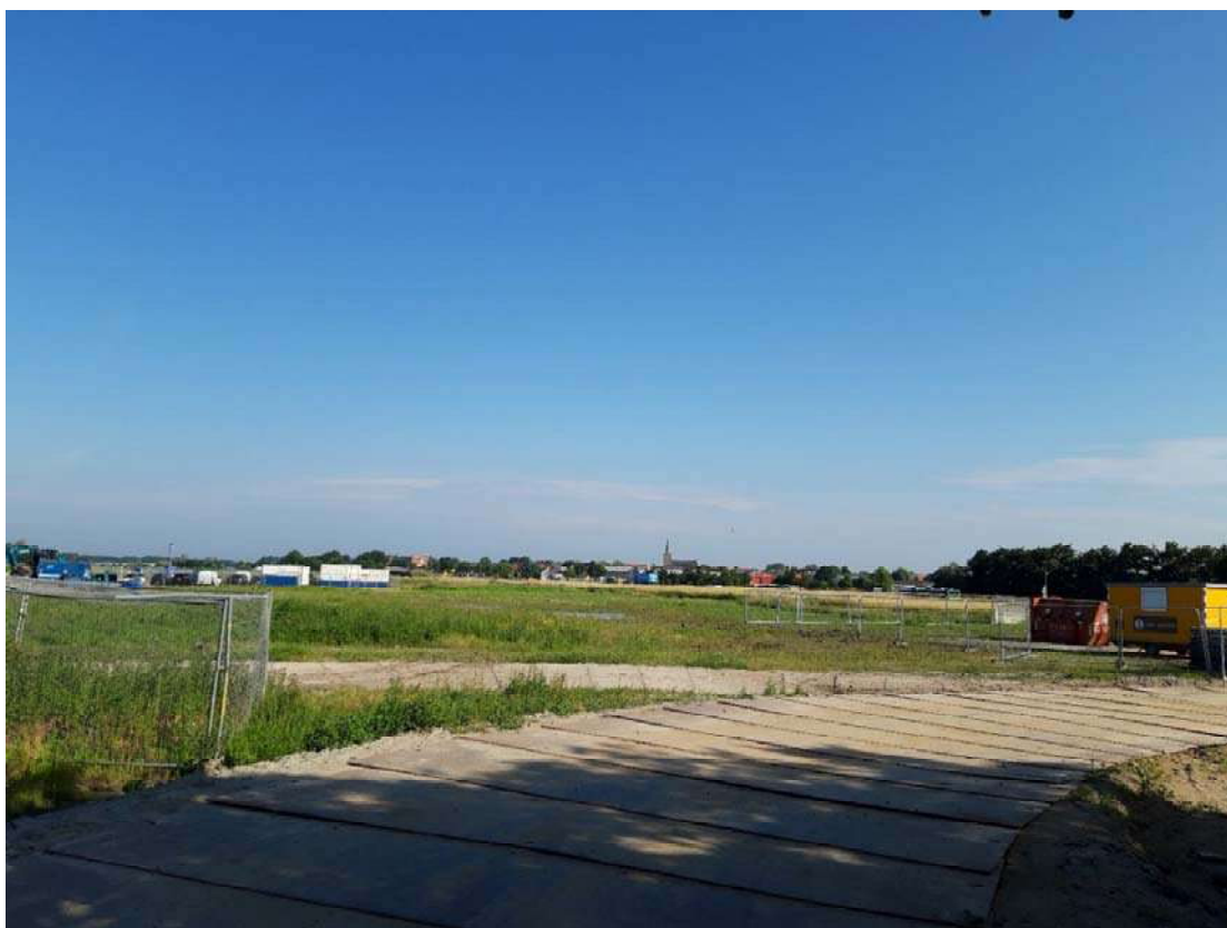
Figuur 4-5. Bouwterrein ter hoogte van de achterweg met mogelijk geschikt habitat voor rugstreeppad.