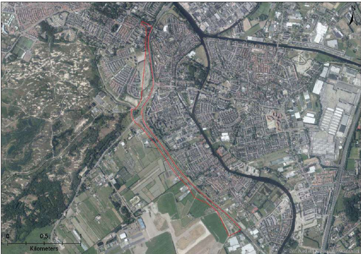
Figuur 3-1. Ligging van het plangebied aangegeven met rode lijn.

De provincie Zuid-Holland is voornemens een busbaan aan te leggen naast de N206 tussen Leiden en Katwijk (Figuur 3-1). In het westen van de weg is vooral bebouwing. In het oosten van de weg ligt vooral agrarisch landschap. Ook Natura 2000-gebied Meijndel & Berkheide ligt oostelijk van de N206. Het plangebied bestaat met name uit agrarisch grasland. Ook bevinden zich er verscheidene watergangen. Figuur 3-2 Figuur 3-8 geven een impressie weer van het plangebied.