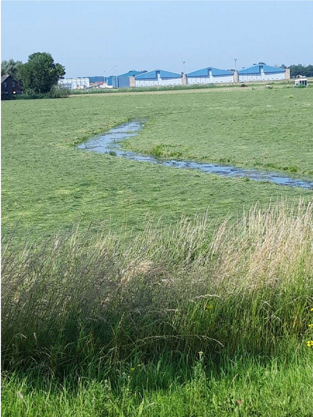
Figuur 4-6. Sloot aan de Kooltuinweg met mogelijk geschikt habitat voor rugstreeppadden.

Conclusie: In het plangebied komen mogelijk rugstreeppadden voor. Een overtreding van verbodsbepalingen ten aanzien van amfibieën kan daarom niet op voorhand worden uitgesloten.