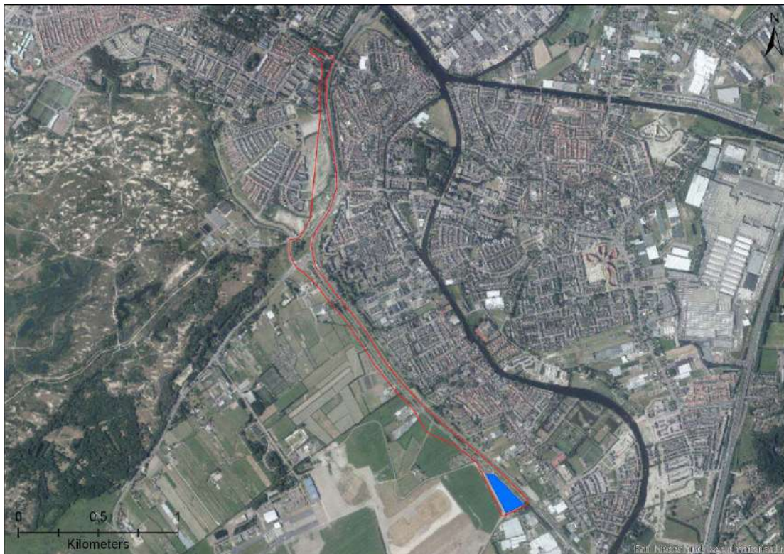
Figuur 4-4. Weergave van mogelijke geschikt habitat voor rugstreeppadden (in het blauw) binnen het plangebied (rood omlind).