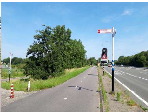
Figuur 4-2. Bomenrij langs de N206 ter hoogte van de Zanderij.