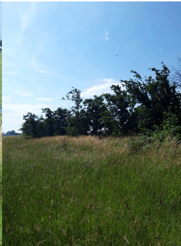
Figuur 3-5. Foto gemaakt onder Achterweg viaduct.